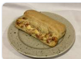
Panini skinke ost