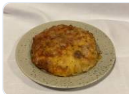
Focaccia med skinke-ost