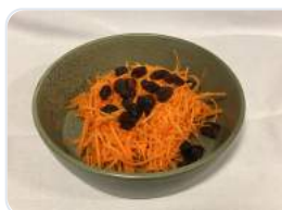
Gulerodsråkost med rosiner