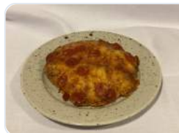
Focaccia med pepperoni &amp; ost